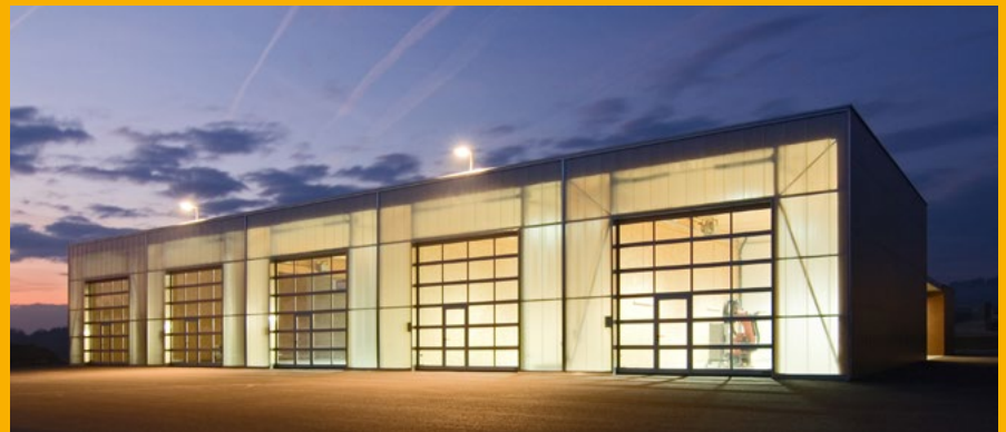
Industriesektionaltore mit integrierter Schlupftür.