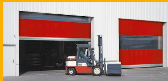
Lagerhalle mit Schnellauftoren.