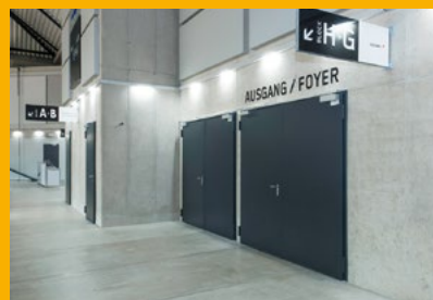
2-flügelige Feuerschutztüren in einer Multifunktionsarena. (Foto: Novoferm)