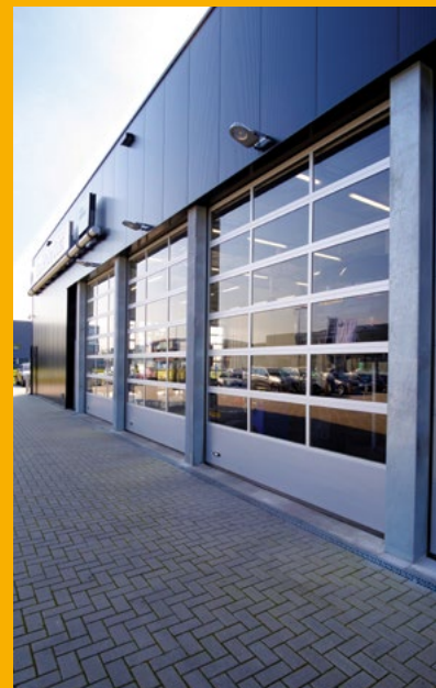
Autowerkstatt mit verglasten Industriesektionaltoren.