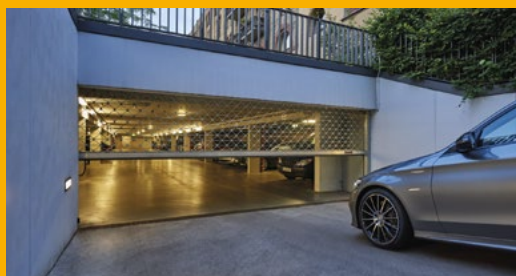
Rollgitter für eine Tiefgarageneinfahrt.