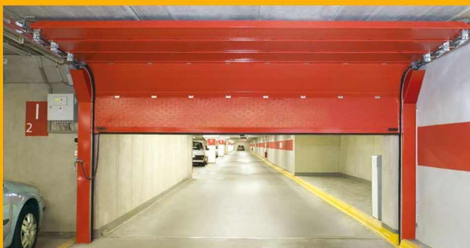
Brandschutztor in einer öffentlichen Tiefgarage.