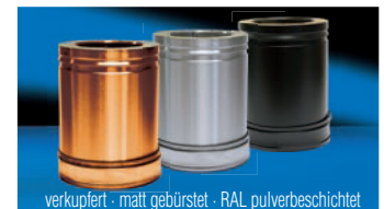
verkupfert - matt gebürstet - RAL pulverbeschichtet