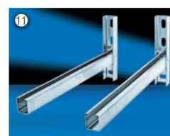
Konsole K bis K3