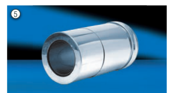
Waddurchführung WDF (alternativ)

Alle notwendigen Teile für einen kompletten Schornstein (Bodenmontage) sind im Lieferumfang enthalten. Bei höheren Schornsteinen einfach mit den entsprechenden Rohrlängen und Wandbefestigungen ergänzen.