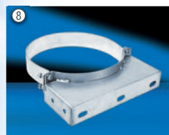
Wandbefestigung WBN, WBV